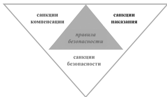
Рисунок 1. Соотношение правил безопасности и санкций за их нарушение

В соответствии с этой идеей можно выделить две группы правовых норм: 1) стимулирующие и 2) ограничительные. Правила безопасности — это диспозиции ограничительных норм. За их нарушение следует три разновидности санкций: безопасности, наказания и восстановления (см. рис 1).