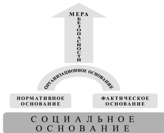
Рисунок 2. Основания применения мер безопасности

Социальное основание мер безопасности образует необходимость пресечения вредного влияния источника опасности либо ограждения объекта охраны (ценностей) от вредного воздействия источников (объектов, субъектов и деятельности) опасности посредством ограничения прав и свобод личности. Объект охраны должен быть подлинной общественной ценностью, а источник опасности реальным. При этом вред, вынужденно причиняемый личности (если её свойства являются источником повышенной опасности), либо третьим лицам должен быть меньше предотвращаемого вреда. Соразмерение вреда осуществляется по принципам, похожим на правила крайней необходимости или необходимой обороны.