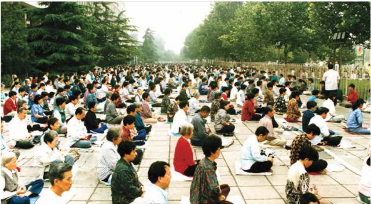
Занятия Фалуньгун в районе станции Мусиди в Пекине до начала преследования в 1999 году

Фалуньгун представляет собой медитативную практику, в основе которой лежат древние китайские традиции оздоровления организма и самосовершенствования, а также принципы истины, доброты и терпения. К концу 90-х годов по подсчётам китайского правительства, Фалуньгун занимались 70 миллионов человек. Эту цифру также цитируют некоторые западные СМИ.