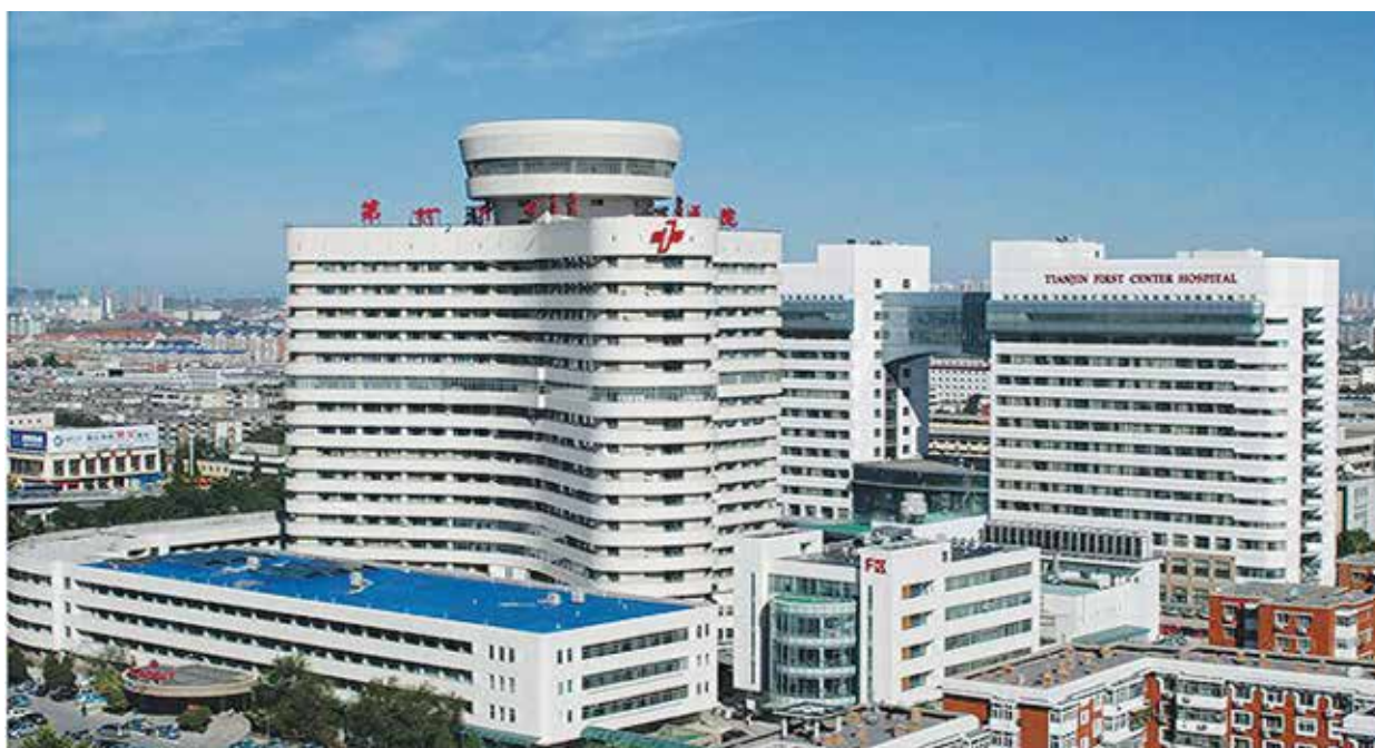
17-этажное здание Восточного центра трансплантологии при Первом центральном госпитале города Тяньцзинь на 500 коек, открытое в 2006 году

Всего несколько клиник уже осуществляют число операций, сопоставимое с официальной цифрой – 10 000. Однако даже это далеко от истинной картины. Более 1 000 клиник в 2007 году подали заявку на продление разрешения на проведение операций по пересадке органов. Это позволяет предположить, что они также соответствуют минимальным требованиям Министерства здравоохранения к центрам трансплантации. Многие из этих клиник продолжили свою деятельность несмотря на отсутствие разрешения.