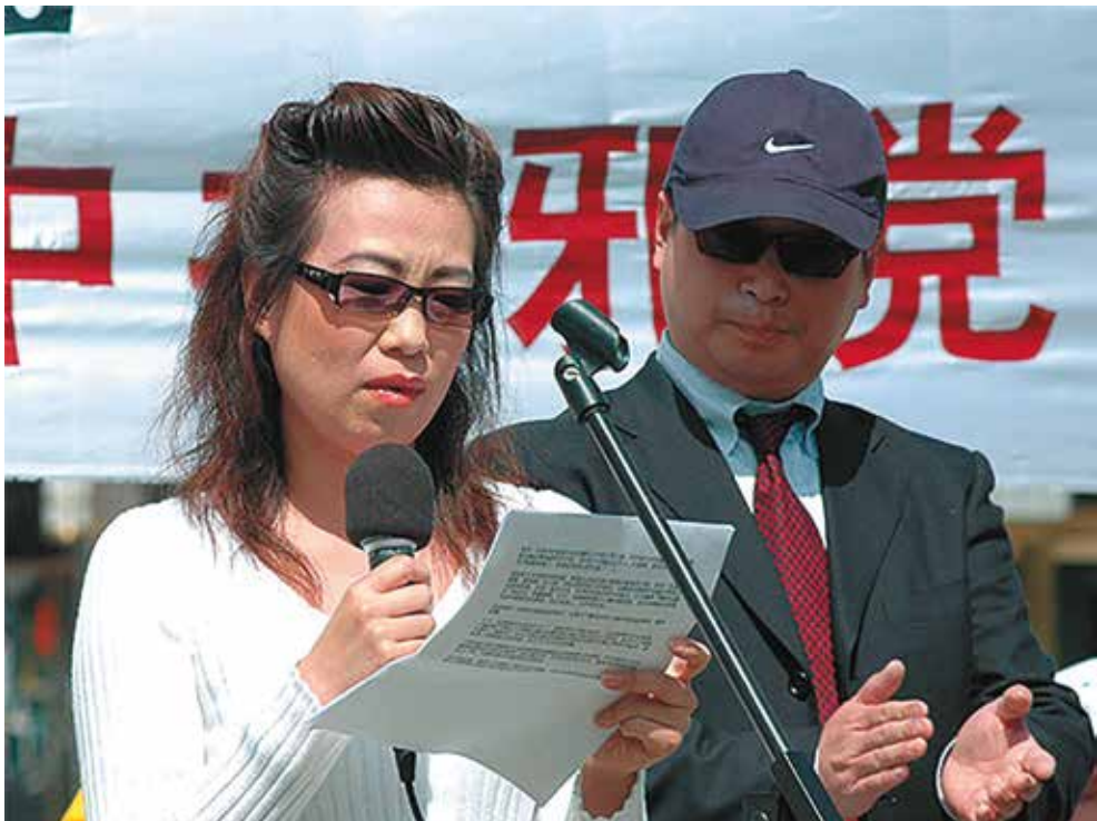
20 апреля 2006 года свидетельница на митинге в США публично разоблачила насильственное извлечение органов, осуществляемое в Китае

Впервые этот вопрос возник в марте 2006 года после заявления женщины о том, что в госпитале вблизи города Шэньян, где она работала, было убито ради извлечения их органов 4 000 последователя Фалуньгун. Её муж, работавший хирургом в том же госпитале, рассказал ей, что в период с 2000 по 2001 год он провёл 2 000 операций, извлекая роговицы глаз у живых людей, последователей Фалуньгун.