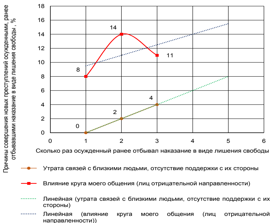
Рис. 1. Причины совершения новых преступлений

Вместе с тем, к сожалению, не всегда близкие, с которыми осужденные поддерживают связи, оказывают положительное влияние на них и способствуют их исправлению и ресоциализации. Это также является проблемой. В криминологии есть ряд теоретических положений о том, что семья имеет влияние на состояние преступности. Так, теория дифференциальной ассоциации Э. Сатерленда основывается, в частности, на том, что преступность является результатом связей в малых микрогруппах и обучения личности противоправному поведению в них. Эта теория объясняет роль подражания в формировании преступного поведения, механизм восприятия индивидом у социальной среды криминальных знаний и умений [1]. Основываясь на данной теории, можно утверждать, что в кругу общения, где авторитетом пользуется лицо, ведущее преступный образ жизни, им оказывается негативное влияние на других субъектов взаимодействия, способное привести к совершению последними преступлений.