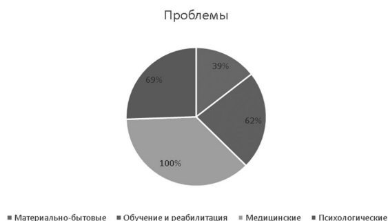
Рис. 1. Диаграмма. Проблемы родителей, воспитывающих детей с инвалидностью, по результатам методики В.В. Ткачевой «История жизни с проблемным ребенком»

На диаграмме рис. 1 можно увидеть, что 39% (5) родителей имеют материально-бытовые проблемы, 62% (8) сталкиваются с проблемами в сфере обучения и реабилитации ребенка, для 100% (13) респондентов актуальны проблемы с получением медицинского обслуживания, 69% (9) испытывают психологические трудности, связанные с воспитанием ребенка с инвалидностью.