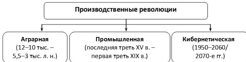
Рис. 1. Производственные революции в истории

Каждая производственная революция включает в себя три фазы: две инновационные (начальную и завершающую) и одну среднюю, располагающуюся между инновационными, – модернизационную (см. рис. 2).