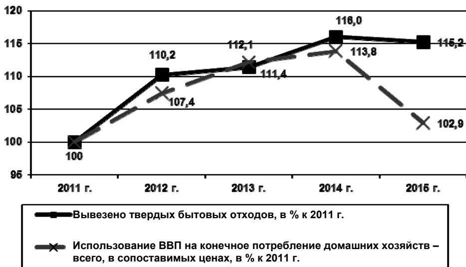
Рис. 2. Изменение объема вывезенных из селитебных зон ТБО и величины ВВП, использованной на конечное потребление домашних хозяйств в России

Очевидно, что размеры декаплинга могут быть представлены в первую очередь в графическом виде или в форме простого соотношения темпов роста/снижения какого-либо натурального показателя природопользования (включая индикатор негативного воздействия на окружающую природную среду) и темпов роста/снижения отобранного макроэкономического агрегата в постоянных ценах . При этом в цифровом виде данное расхождение, по нашему мнению, статистически корректно показывать в процентных пунктах, п. п. (то есть разницей между процентами). В случае относительного декаплинга при одновременном снижении темпов двух рассматриваемых векторов процентные пункты целесообразно давать с отрицательными знаками. При наличии абсолютного декаплинга результаты могут приводиться по модулю разницы для показателей с положительным и отрицательным знаками.