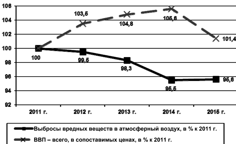
Рис. 1. Изменения объема выбросов вредных веществ в атмосферный воздух и величины ВВП в России

Относительный декаплинг, кроме соотношений, описанных в ПРД СПЭУ, наблюдается в случаях, когда темпы роста природопользования/вредного воздействия на природу превышают (опережают) темпы роста выбранного макроагрегата. В частности, из рис. 2 следует, что в 2012 г. по сравнению с 2011 г. и в 2014 г. по сравнению с 2013 г. увеличились как объем потребленного ВВП, так и вывоз ТБО из селитебных зон. Однако темпы роста вывоза ТБО за эти периоды оказались выше, нежели темпы роста ВВП, использованного на конечное потребление домашних хозяйств.