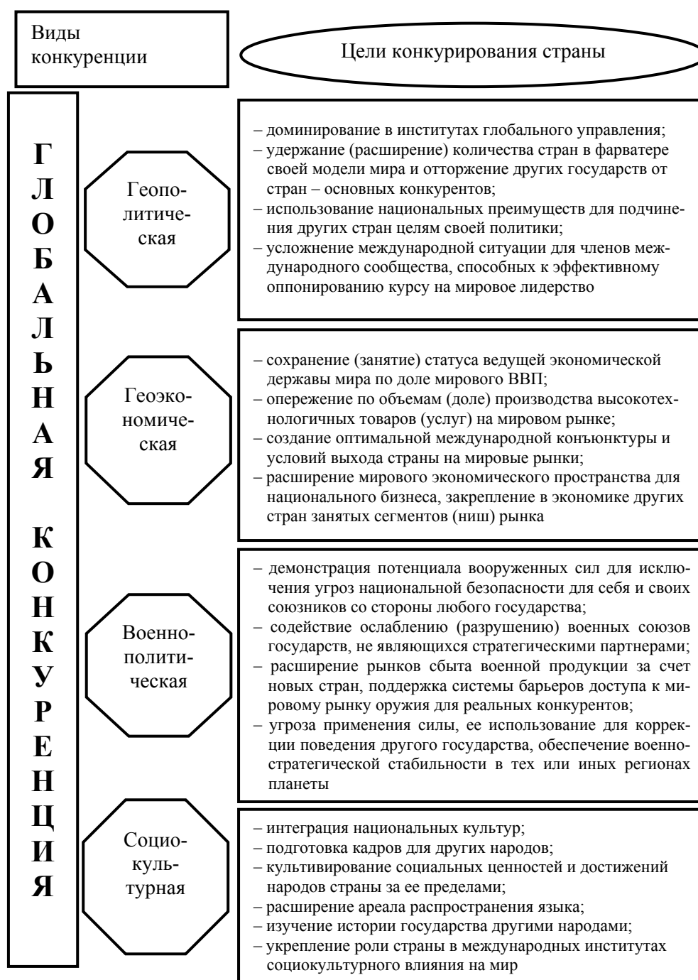
Рис. Основные виды и цели глобальной конкуренции государств