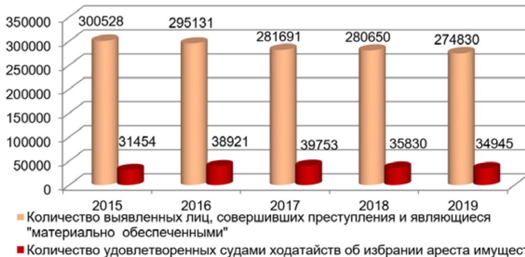
Гистограмма 2. Динамика наложения ареста на имущество в досудебном производстве по уголовным делам (с учетом количества выявленных лиц, совершивших преступления) 3

ми или лицами, несущими по закону материальную ответственность за их действия, при условии, что есть достаточные основания полагать, что это имущество получено в результате преступных действий подозреваемого, обвиняемого либо использовалось или предназначалось для использования в качестве орудия, оборудования или иного средства совершения преступления либо для финансирования терроризма, экстремистской деятельности (экстремиз-