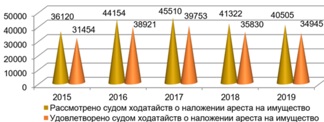
Гистограмма 1. Динамика избрания меры процессуального принуждения в виде наложения ареста на имущество в досудебном производстве по уголовным делам 2

иных претензий имущественного характера, предусмотренных ч. 1 ст. 115 УПК РФ. Верность указанного подтверждается анализом уголовно-процессуальной практики, свидетельствующим о том, что в течение 2015–2019 гг. властные субъекты досудебного производства достаточно часто обращались в суд с ходатайствами о наложении ареста на имущество (35–45 тыс.), которые в большинстве случаев удовлетворялись судами: в 2015 г. — 87,1 %, в 2016 г. — 88,1 %, в 2017 г. — 87,4 %, в 2018 г. — 86,7 %, в 2019 г. — 86,3 % (см. гист. 1).