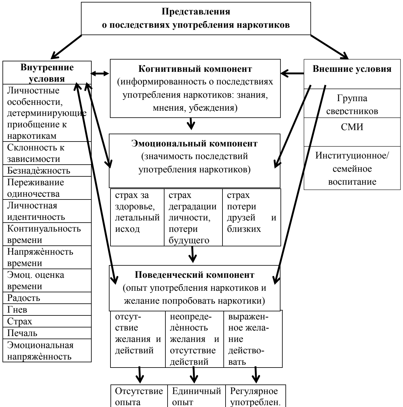
Рисунок 1- Модель представлений подростков о последствиях употребления наркотиков.

Менее существенное влияние особенности личности оказывают на эмоциональный компонент, что выражается в опасении только простых физических последствий употребления наркотиков при низком уровне личностного развития и опасении сложных отдалённых последствий употребления наркотиков при высоком уровне личностного развития. На основе этих опасений у подростков строится негативное отношение к употреблению