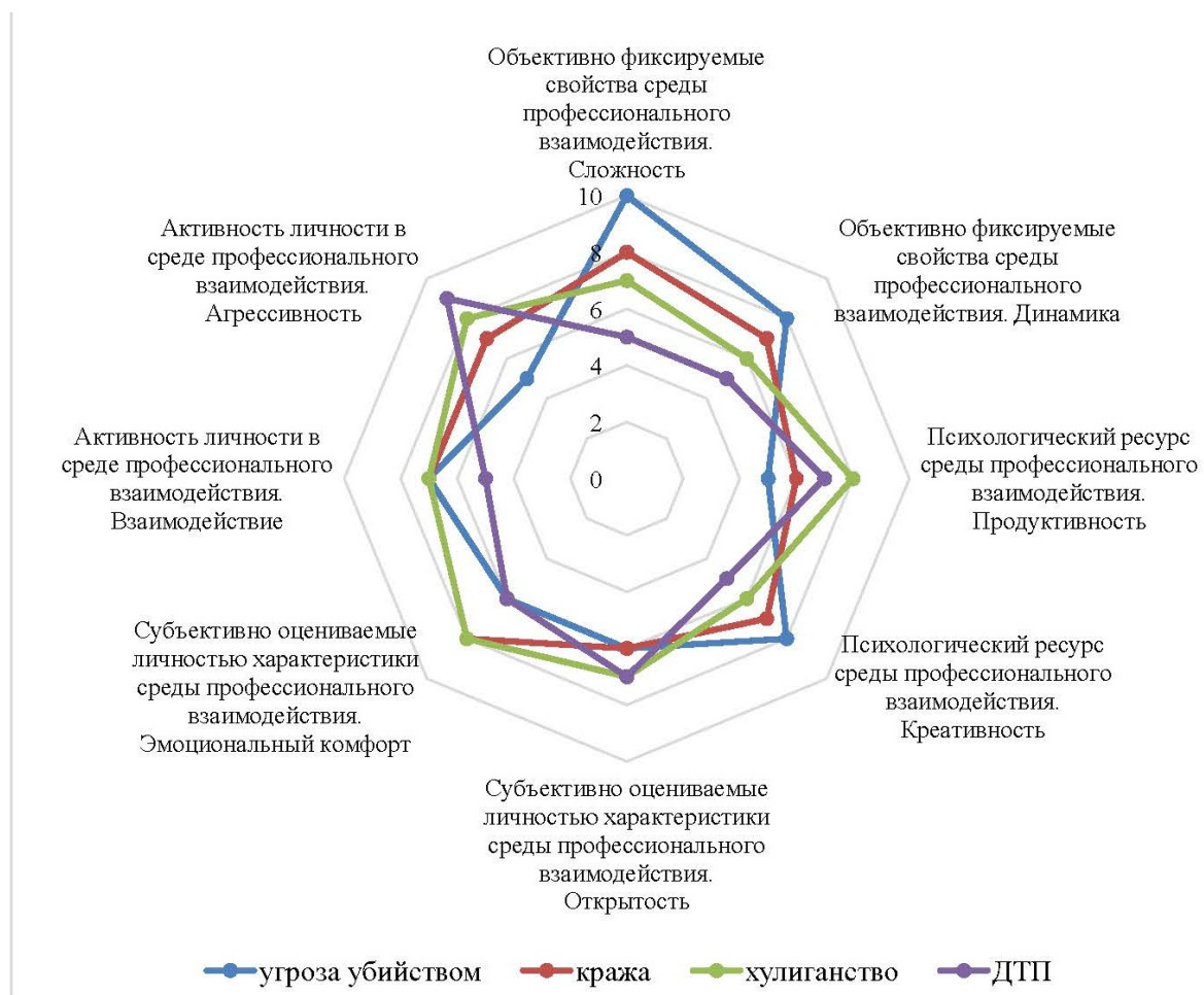
Рисунок 2 - Результаты экспертной оценки (n=18) среды проведения дознания по конкретному виду совершенных преступлений (в средних по всем рассмотренным преступлениям (90 преступлений) (в 10-балльной шкале)

параметров среды сотрудниками ОВД в целом сопоставимы с соответствующими оценками других участников уголовного процесса. На рисунке 2 представлены результаты усредненных экспертных оценок среды профессионального взаимодействия всеми сотрудниками ОВД–участниками уголовного процесса.