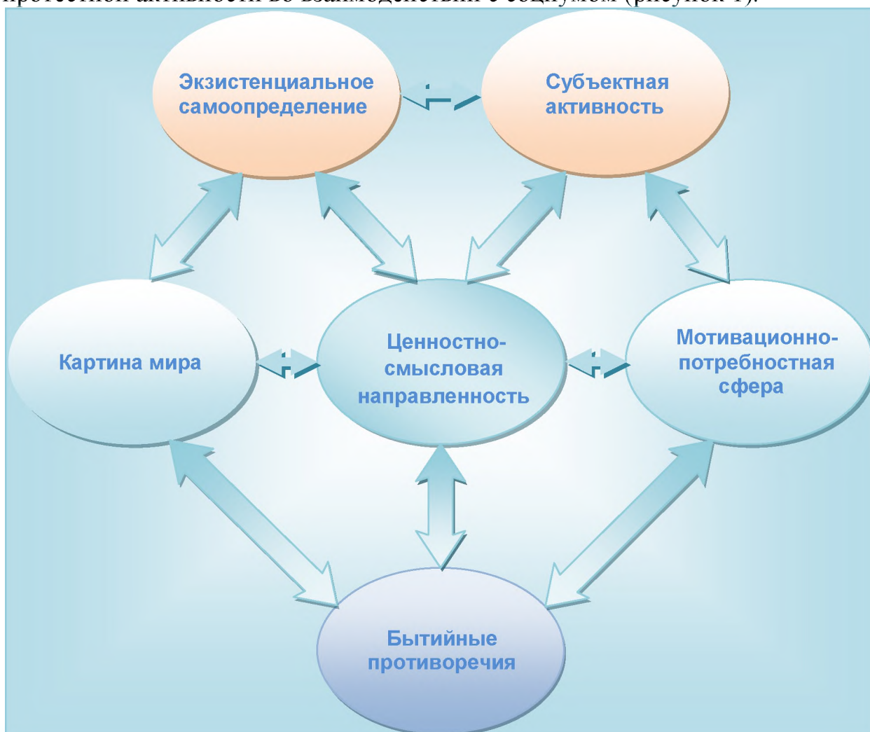
Рисунок 1. Компоненты структурно-диалектической модели протестной активности личности.

широком онтологическом плане как способов бытия личности. Уяснение генезиса, формообразования и содержания протестной активности личности как многокомпонентной структуры предлагается осуществлять через анализ специфики субъектной активности личности и характера экзистенциального самоопределения в сочетании с особенностями ценностно-смысловой, мотивационно-потребностной сфер личности, картины мира, бытийных противоречий и способов их разрешения. В §3.3 предлагается структурно-диалектическая модель протестной активности личности , позволяющая сравнивать психологические характеристики различных форм протеста, прогнозировать возможные эффекты протестной активности, в том числе отслеживать поворот личности к конструктивной или деструктивной протестной активности во взаимодействии с социумом (рисунок 1).