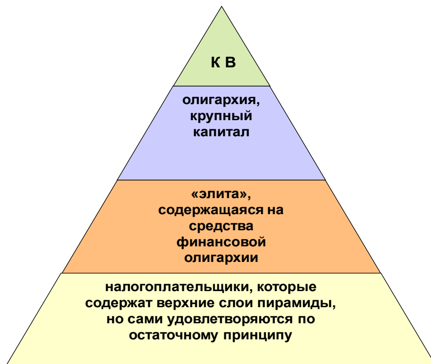
Рис.2. Толпо-элитарная структура общества

основана на господствующем мнении, т. е. на духе. 7 Власть, таким образом, полагается фрагментом духовной культуры и получает культурологическую трактовку. Эти мысли созвучны идеям французского социолога Э. Дюркгейма, который считал, что общество основывается, прежде всего, на идее, которую оно в себе осознает. 8 При этом способ осознания такой идеи обусловлен разделяемой большинством общества единой позицией, которая определяет взгляд каждого гражданина на свою общую историю, свое настоящее и будущее. То есть на общий замысел жизнеустройства или — концепцию. Поэтому концептуальная власть проявляется и как власть концепции, по которой живет общество, над массовым сознанием.