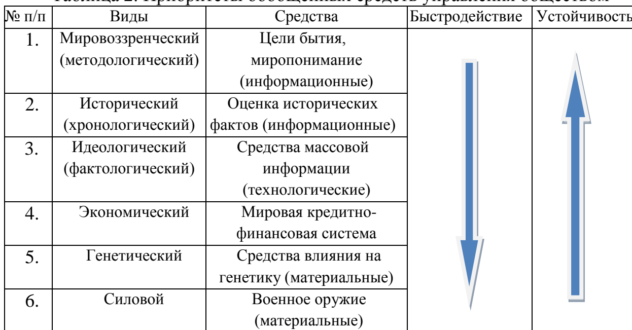
Таблица 2. Приоритеты обобщенных средств управления обществом

Третья глава «Перспективы становления русской концептуальной власти в эпоху глобализации» состоит из трех параграфов и посвящена анализу содержания и соотношения понятий «глобализация» и «цивилизация», а также выявлению социокультурных основ русского типа цивилизации. Диссертантом обосновывается необходимость разработки собственной концепции развития России как важнейшее условие сохранения и развития русской цивилизации в XXI веке. Разработаны предложения для осуществления мер по всем приоритетам обобщенных средств социального управления, обеспечивающие перспективы становления русской концептуальной власти.