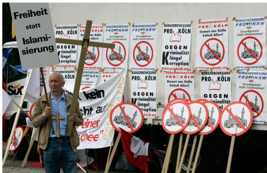
Рисунок В.9 – «Свобода вместо ислама» - лозунг «про - Кёльн» и «про - движения в целом» 529