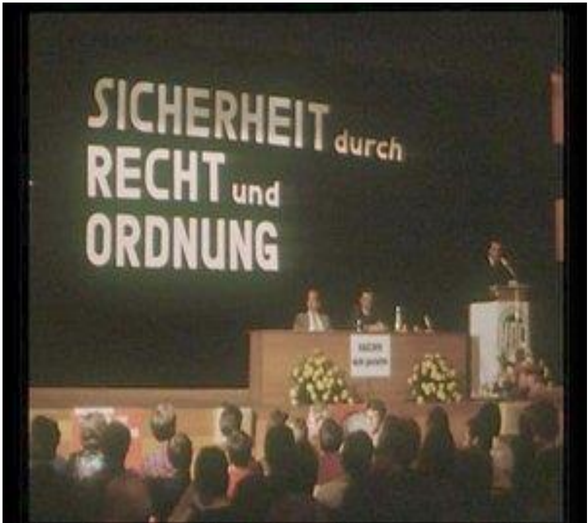
Рисунок В.1 – Создание НДПГ – 1964 г. 521