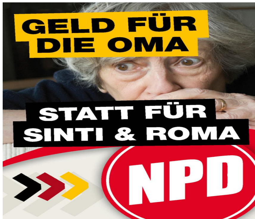
Рисунок В.3 – Современный агитационный плакат НДПГ 523