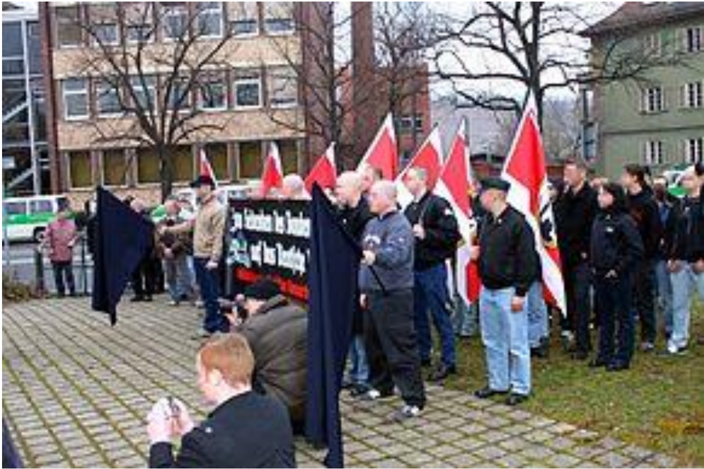
Рисунок В.5 – Митинг НДПГ 525