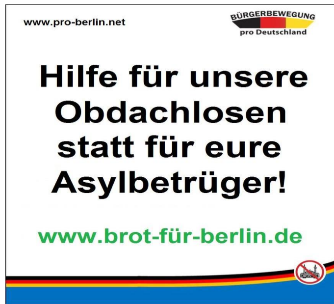
Рисунок В.6 – Сбор средств для помощи бездомным немецким гражданам, организованный «про - Германия» 526