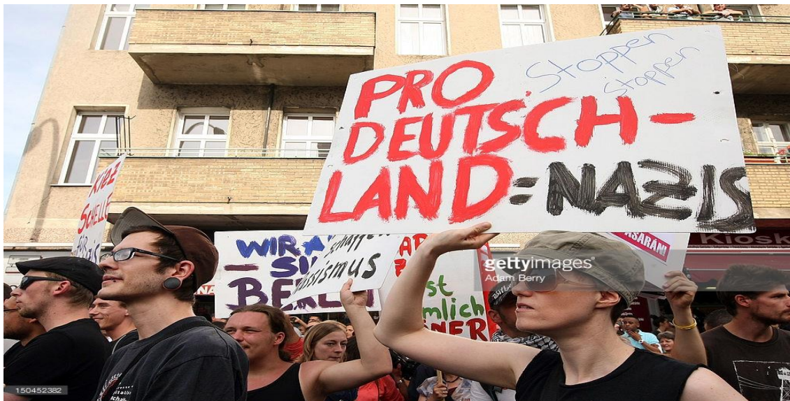
Рисунок В.7 – Митинг против «про - Германия» 527