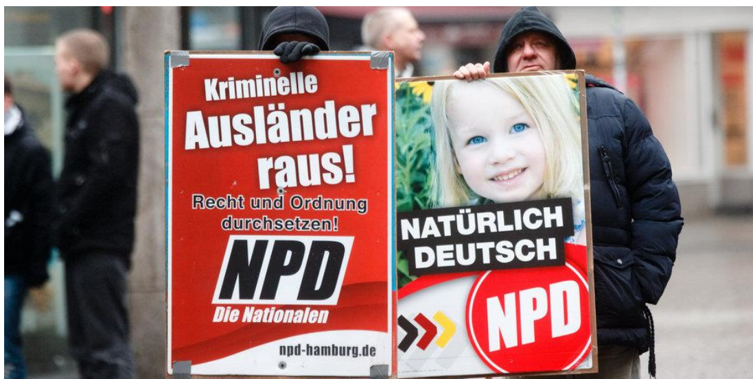
Рисунок В.4 – Пропаганда НДПГ во время демонстраций 524