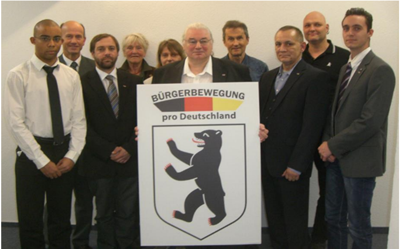
Рисунок В.10 – Члены региональной организации «про - Германия» в Берлине 530