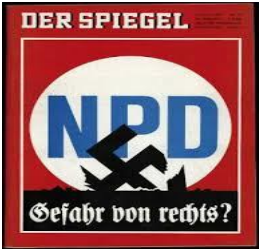
Рисунок В.2 – НДПГ. Опасность справа? 522