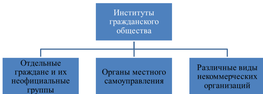
Рис. 1. Группы институтов гражданского общества.