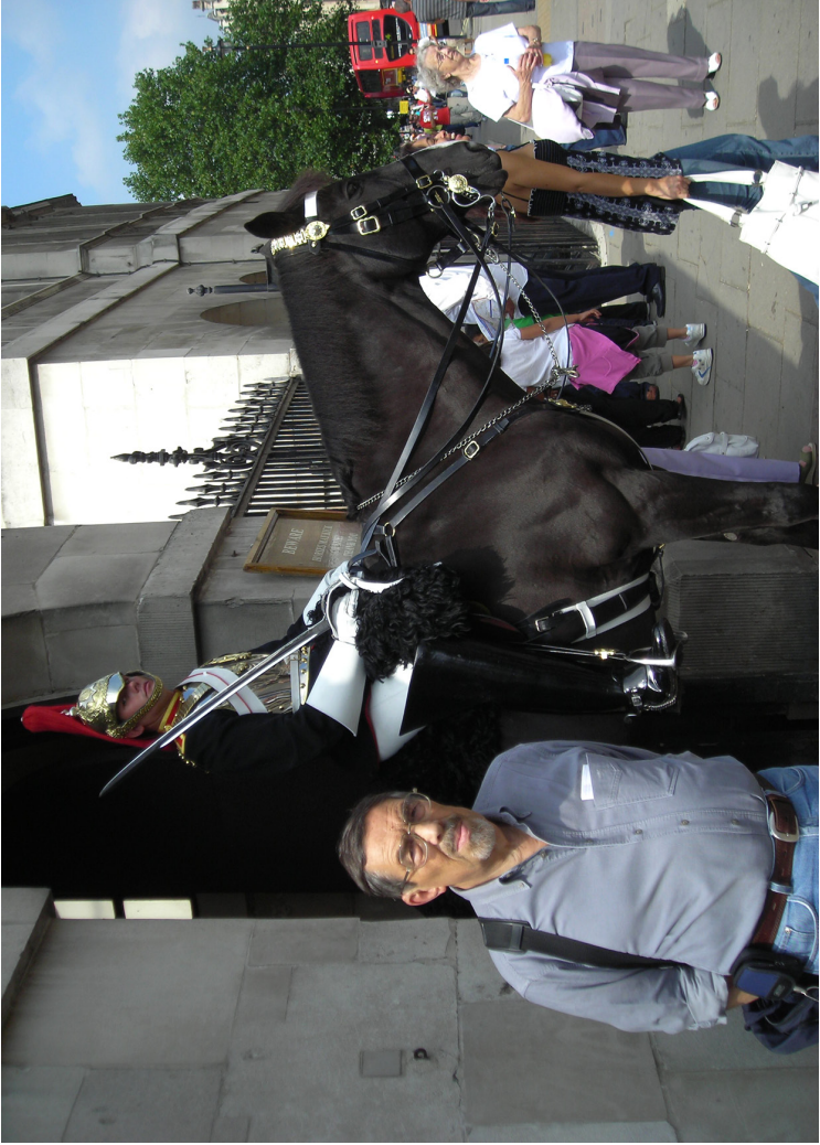
Я в Лондоне