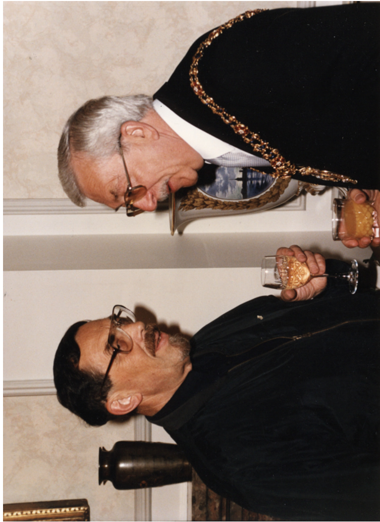
С мэром Манчестера. Беседа о наших городах...