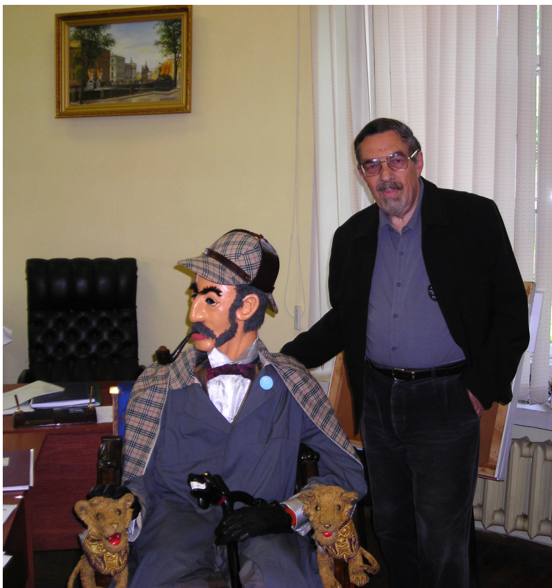
Я на «своей» кафедре. В гостях – Шерлок Холмс (пришел из криминалистической лаборатории)