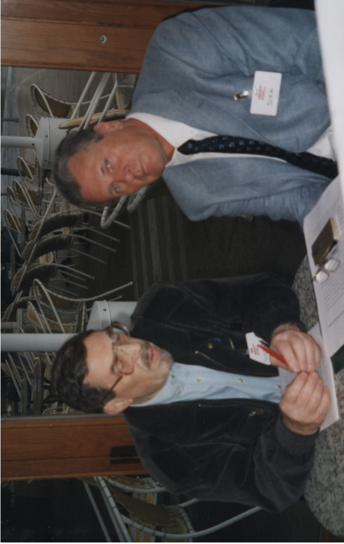
С 2-ном Сика. Как быть с вопросом: Who is Mr. Putin?