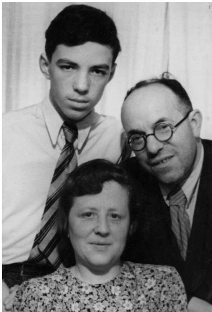
Папа, мама и я