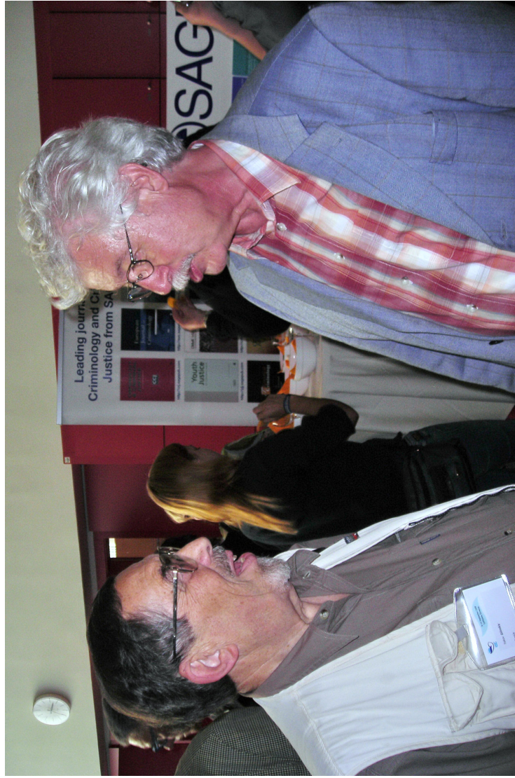
Любляна. Дискуссия с проф. Х.-Ю. Кернером (Германия)