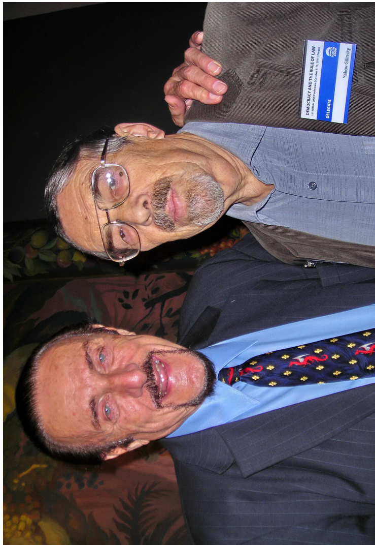
Исследователи зла (Ф. Зимбардо, Я. Гиллинский)