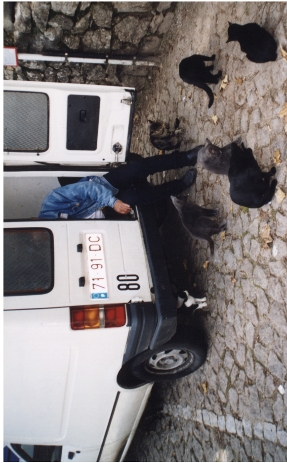
Португальские кошки хорошо знают время кормежки