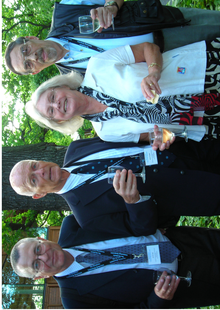
Гостеприимный Университет Стокгольма