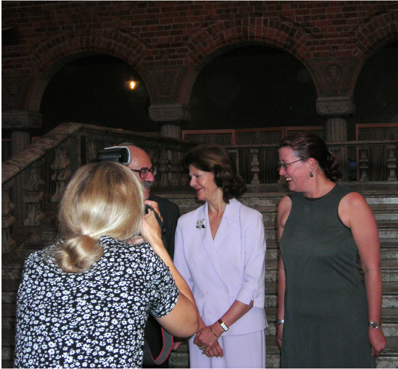
Королева Швеции Сильвия (в центре) с лауреатами Премии по криминологии