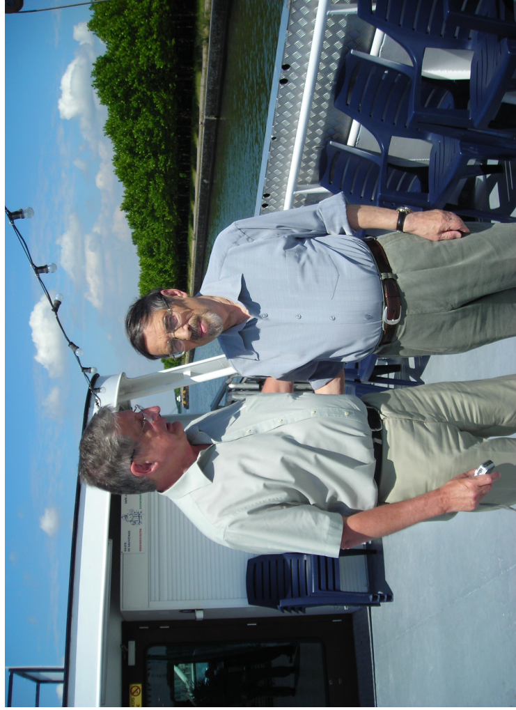
Из Льежа в Маастрихт. Беседа с председателем Верховного Суда Польши