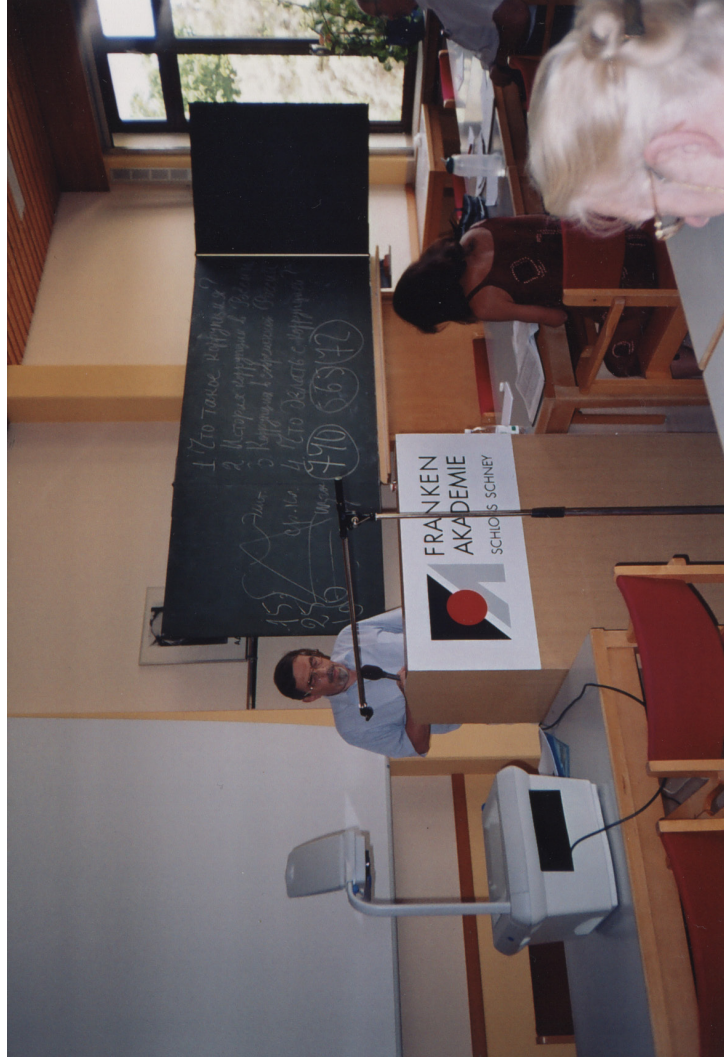
Выступая в Русском Свободном Университете им. А. Сахарова (Бавария)