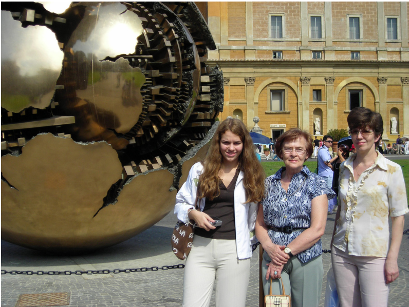
Мои девочки в Риме и Ватикане