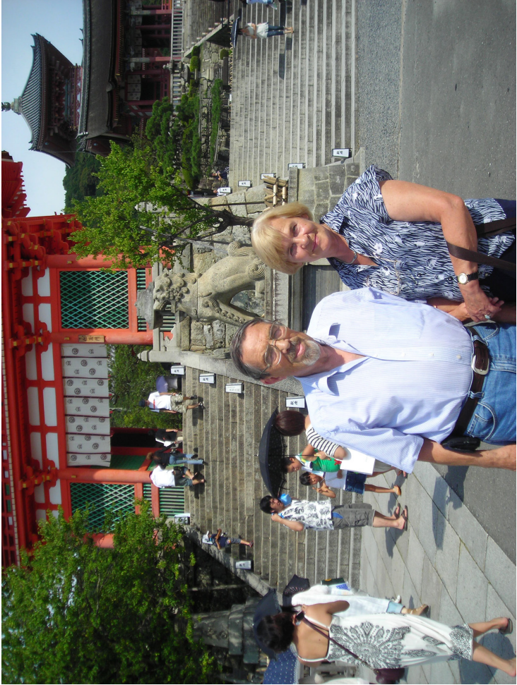
С Хамашией в Куоно