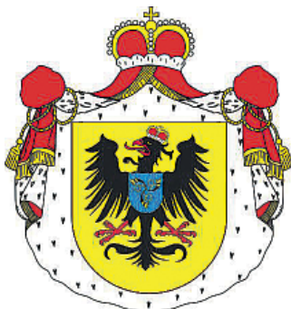
Герб князей Радзивиллов.

В польском подполье действовала и дефен-